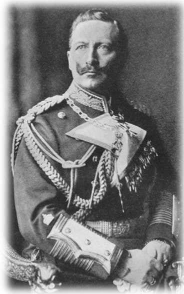
Фото в любимом стиле: военная форма и решительный взгляд

Второстепенные военные «добродетели» и доблести выходили на первый план. Среди гражданского населения приветствовались бравая военная выправка и испепеляющий взгляд, а в армии – сверкающие чистотой сапоги и опрятная форма. За невычищенную до блеска обувь или «некорректно сидящий» мундир могли наказать недельным заключением в карцере на воде и хлебе 1 .