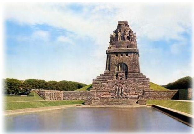
Памятник битве народов